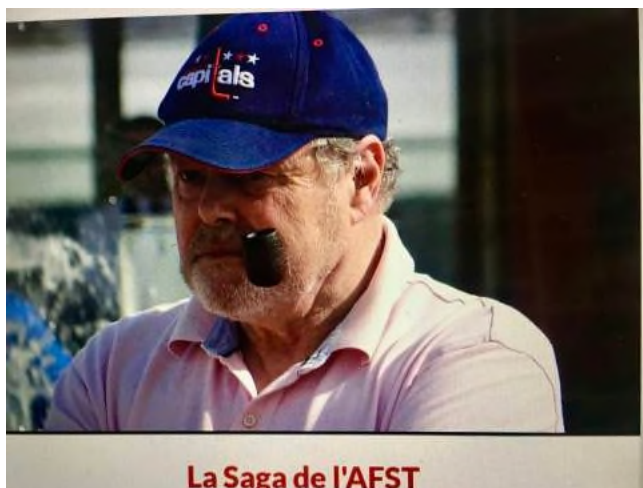
La Saga de l'AFST