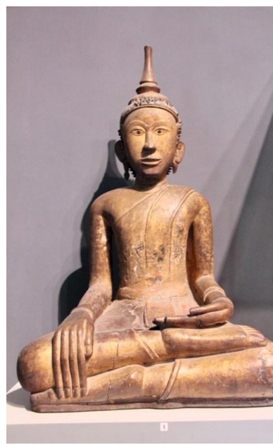
Musée de l'histoire du Vietnam