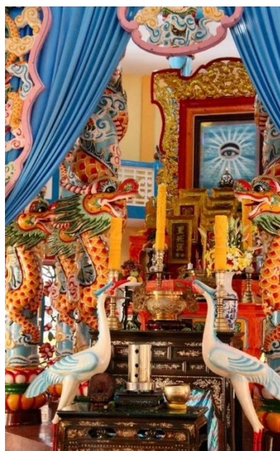
Temple Thanh Pho à Sa Dec