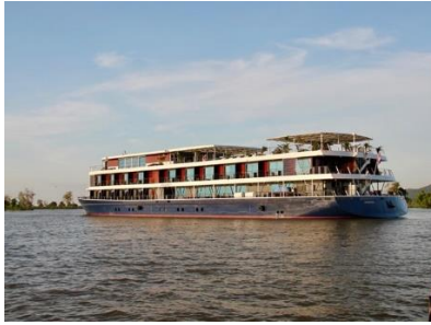
Navigation sur le Mékong