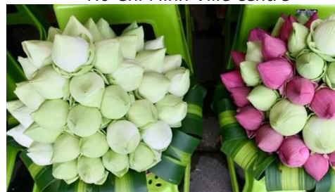
Bouquet de fleurs de lotus