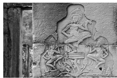
Angkor Thom - Bayon

Inconditionnel de l'Asie, de ses marchés, de ses effluves, de sa gastronomie, de sa végétation exubérante, mettez le cap sur le Cambodge et le Sud du Vietnam !