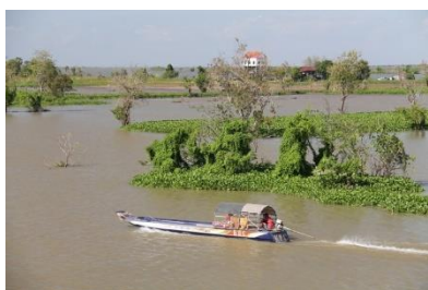
Pirogue sur le lac Tonlé Sap