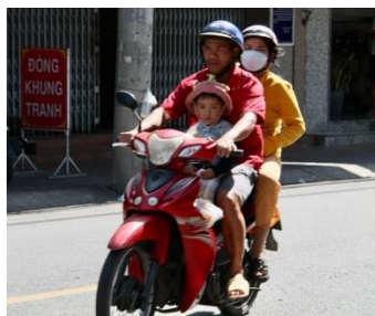
7 millions de scooters