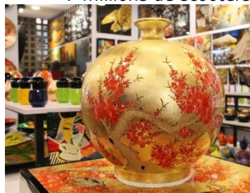
Vase en laque 3/3