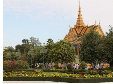
Palais Royal de Phnom Penh

On quitte la plus grande cité médiévale du monde, dissimulée dans la jungle, hantée de légendes pour embarquer à bord d'Indochine II, naviguer sur le Tonlé Sap et ensuite sur le Mékong , fleuve mythique, sacré, sauvage et domestiqué assurant le lien entre les peuples. Balai incessant de pirogues, bordé de cités lacustres commerçantes, il assure la survie de ses riverains même si certaines crues peuvent être catastrophiques.