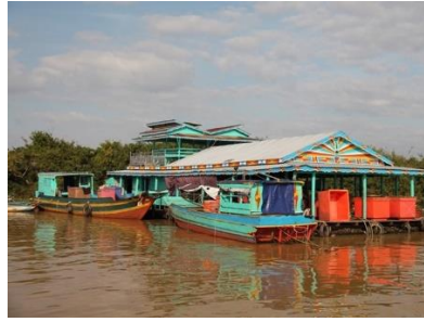
Habitations sur le lac