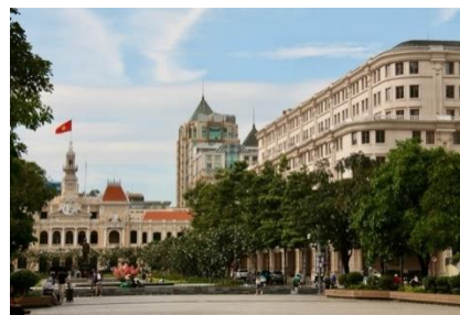
Ho Chi Minh Ville centre