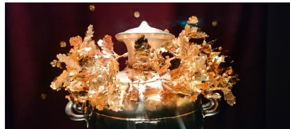
Couronne royale en chêne

C'est le plus grand bâtiment de la Grèce classique et le plus important après le Parthénon. Erigé en 350 avant JC par le roi de macédoine Philippe II (le père d'Alexandre le Grand), ce site sera partiellement détruit par les Romains et fera l'objet d'un classement par l'Unesco en 1996. Durant 15 ans une restauration sera entreprise et mettra en évidence des sols en marbre, des mosaïques aux motifs complexes. Sur ce site où fut célébré le couronnement d'Alexandre le Grand, un des plus importants conquérants de l'histoire qui étendit son royaume jusqu'à l'empire perse et jusqu'à l'actuel Pakistan en passant par l'Ouzbékistan, nous visiterons le musée qui renferme des collections uniques au monde et qui nous dévoilent le contenu incroyable de ces tombeaux. Comptez au moins 2h compte tenu des richesses qui y sont exposées.