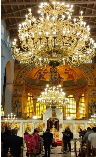
Cérémonie de baptême à l'église St Grégoire