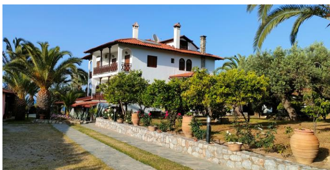
Presqu'île de Sithonia

Puis nous mettrons le Cap sur la Chacidiq connue pour ses 3 presqu'îles (Kassandra, Sithonia et Athos) dont l'une est le mont Athos où seule la gent masculine peut accéder aux monastères occupés par les Moines. Notre première halte sur la presqu'île de Sithonia sera à Vourvourou que l'on surnomme les Caraïbes grecques : vite nous enfilons notre maillot de bain et plouf dans une mer turquoise. Un très beau paysage, une vue imprenable sur les montagnes lointaines de la presqu'île Athos. Un vrai havre de paix en mai ou début juin avant l'invasion des Bulgares et des Roumains mais aussi des Anglais et des Allemands. Quelques petites tavernes, de nombreux appartements et bungalows en bord de mer, un petit hôtel, permettent d'y passer des vacances sublimes.