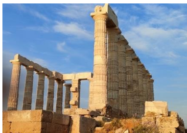
Le temple de Cap Sounion