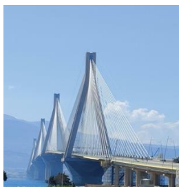
Pont Rion, Antirion