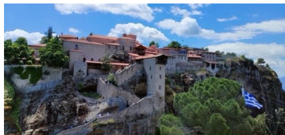
Monastère 'Grand Météores'

Comment la Grèce est devenue pour moi un des plus beaux pays au Monde et je dirai même 'ma seconde patrie'.