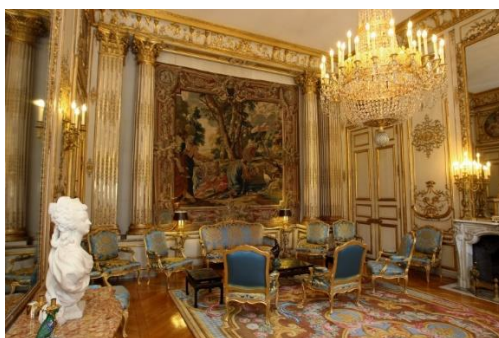
Le salon Pompadour du Palais de l'Élysée

Avant de devenir le plus haut-lieu du pouvoir exécutif, cette demeure construite entre 1718 et 1720 pour le comte d'Évreux a appartenu à de nombreux propriétaires. Ce n'est qu'en 1848 qu'elle devient la résidence d'un Président de la République, situation officialisée vingt-cinq ans plus tard, lors de la proclamation de la Troisième République. Sous l'Ancien Régime, la locataire la plus remarquée a sans doute été la marquise de Pompadour, favorite de Louis XV. C'est en 1753 que le roi décide de lui acheter cet hôtel particulier, alors situé aux portes de Paris. Une décision qui n'a pas vraiment plu aux habitants du coin qui n'hésitaient pas à évoquer la demeure comme « la maison de la putain du roi ». Il faut dire que la jeune femme était un brin excentrique : un jour, elle aurait accueilli un bélier dans son boudoir afin de le présenter à ses invités. Apeuré par son reflet, l'animal se serait mis à courir dans tous les sens... saccageant la pièce au passage !