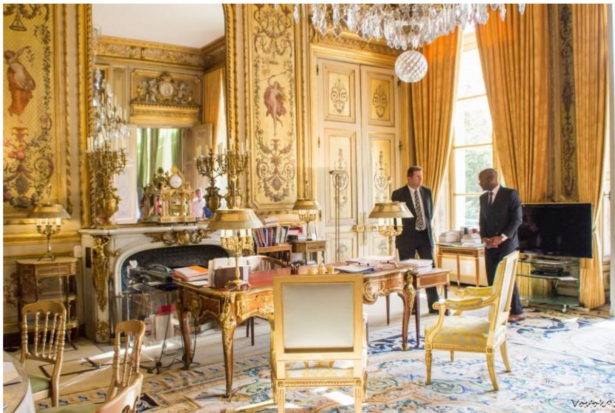
Le bureau du président au Palais de l'Élysée

Tous les présidents n'ont pas eu la chance d'y rester très longtemps. Le locataire resté le moins longtemps dans les murs de l'Élysée est Jean Casimir-Perier. Président de la République entre le 27 juin 1894 et le 16 janvier 1895, il aura vécu au palais pendant seulement six mois et vingt jours ! Il est suivi de près par Paul Deschanel, le président malheureux qui a quitté son poste seulement 7 mois et 3 jours après sa prise de fonction à cause d'une dépression. Au contraire, François Mitterrand y aura passé le plus de temps : 13 ans 11 mois et 26 jours très exactement.