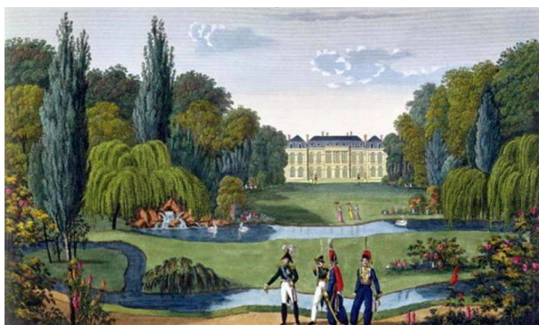
L'Élysée au début du XIXe siècle, peinture par Henri Courvoisier-Voisin (1815)

L'utilisation la plus insolite du lieu a sans doute été celle qui a duré pendant les deux dernières années du Directoire, entre 1797 et 1799. La duchesse de Bourbon, propriétaire du lieu, en manque de moyens, décide alors de le louer à un couple de négociants qui en font un établissement « de plaisirs » : bals populaires ou masqués, jeux, expositions, salons de lecture, tous les divertissements de l'époque pouvaient s'y tenir ! L'événement le plus déroutant qui a eu lieu à cette époque ? Une montgolfière posée dans les jardins qui emmène un mouton dans les airs et le lâche avec un parachute. Tout simplement.